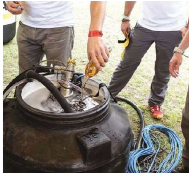
Foto: Equipo de tratamiento de agua de Kärcher

En la actualidad, Kärcher es el proveedor líder de técnicas de limpieza en todo el mundo. La empresa familiar cuenta con más de 11.900 trabajadores y 100 filiales en 65 países. ☺