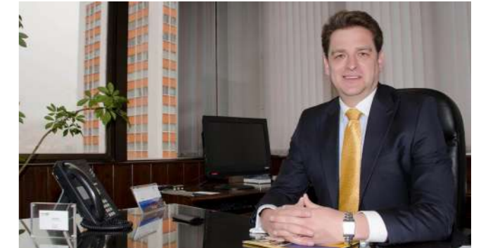
Foto: Vittorio Aloisio, Vicepresidente Nacional de Internacional y Tesorería

empresas al rededor del mundo, en la moneda de su preferencia. El exportador boliviano también puede mantener una cuenta en el Banco BISA en euros, ya que podemos destacar que somos los pioneros en este servicio en Bolivia.