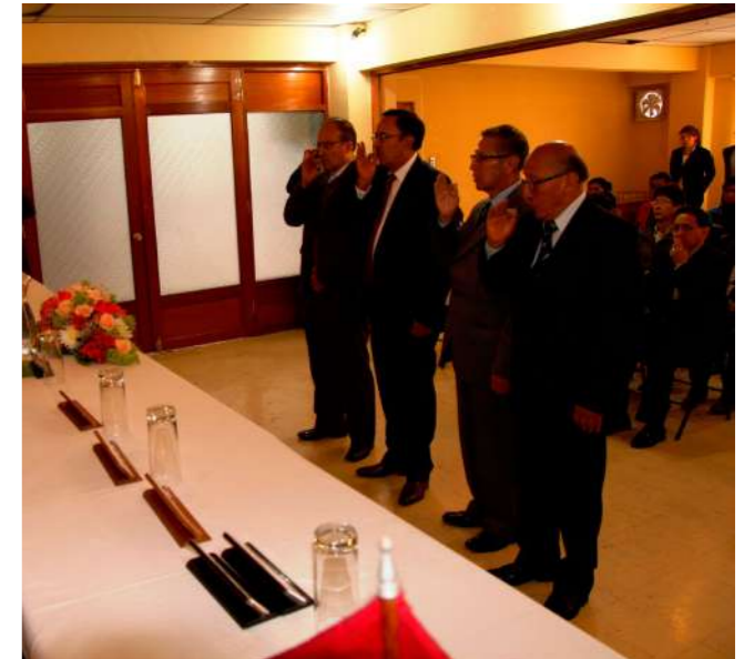
Foto: Posesión del nuevo directorio 2016 - 2018