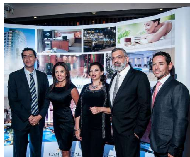
Foto: Directivos del Hotel Camino Real

La autoridad y el ejecutivo, realizaron la plantación de un árbol de Olmo, una de las ocho especies que se plantarán en el proyecto. 🌱