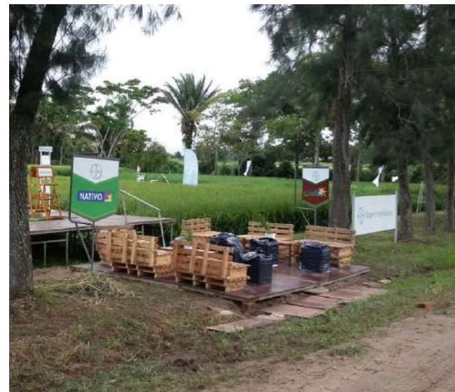
Foto: Stand de Bayer en el día Nacional del Arroz

La Bacteriosis es una enfermedad muy fuerte, ya que en campos de arroz severamente afectados se han reportado pérdidas de hasta un 75% de la producción. El Día Nacional del Arroz recibió a más de 2.000 productores durante los días que se realizó en la que además se destacó la participación de 40 empresas que estuvieron presentes tanto en el campo ferial como en las 8 parcelas demostrativas. ☺