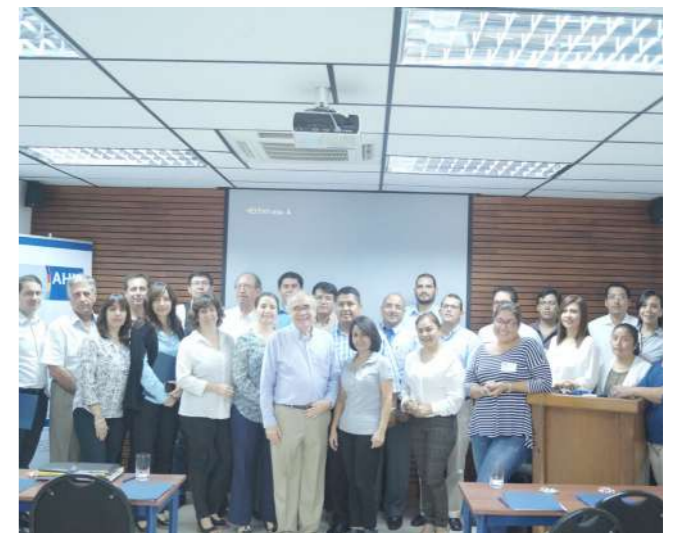
Foto: Participantes del taller