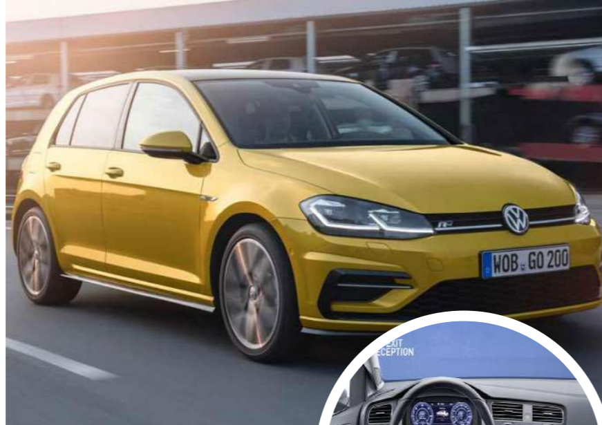
Foto: Nuevo Golf 2017 de Volkswagen

Una vez completada la salida a mercado de toda la serie habrá en total 13 variantes de motorización, entre ellas nuevamente una propulsada a gas, el Plug-in-Hybrid y el e-Golf eléctrico de 85 kW/115 CV. Las versiones diesel -de