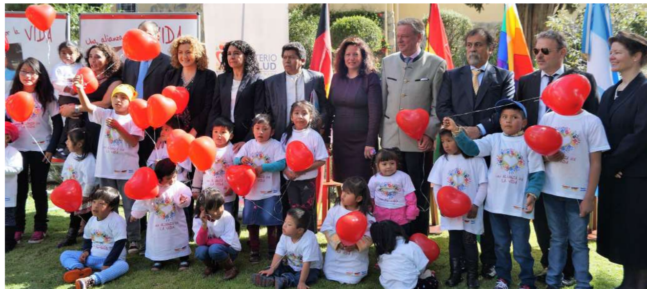
Foto: Representantes del proyecto develoPPP.de y de la cooperación triangular

La asociación entre la Fundación Cardioinfantil y Drägerwerke AG & Co. KGaA concluyó en 2016, pero el compromiso continúa vigente. Los resultados alcanzados en este tiempo propiciaron el inicio de una Cooperación Triangular entre Bolivia, Argentina y Alemania. Esta nueva alianza, liderada por el Ministerio de Salud de Bolivia, permitirá fortalecer las capacidades de los centros de salud bolivianos para la atención de niñas y niños con cardiopatías congénitas. (AW)