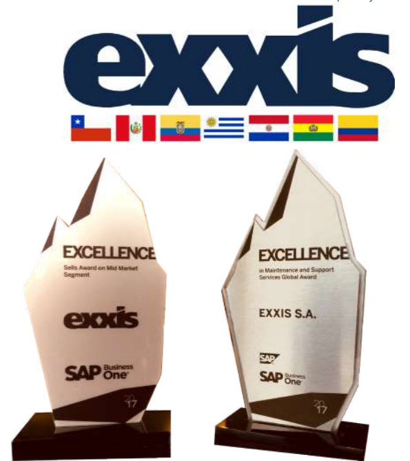
Reconocimientos obtenidos por Exxis Group

industrias, "verticales" propias que se van adaptando a distintas necesidades empresariales como logística, manufactura, construcción, arriendo de activos, cardealer, retail, entre otras. No hay límites y la creatividad es parte de su experiencia, trabajando interdisciplinariamente.