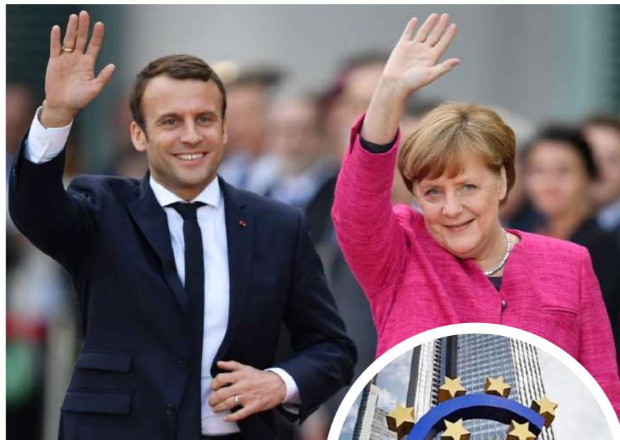
Foto: Emmanuel Macron y Angela Merkel

Las propuestas equilibran claramente intereses de Alemania y Francia: por un lado se refuerzan los instrumentos fiscales y el mecanismo de rescate; por otro, se subrayan las responsabilidades nacionales y los mecanismos de control. Pero detrás del compromiso entre la solidaridad y la responsabilidad propia, la lógica del mercado y la necesidad del