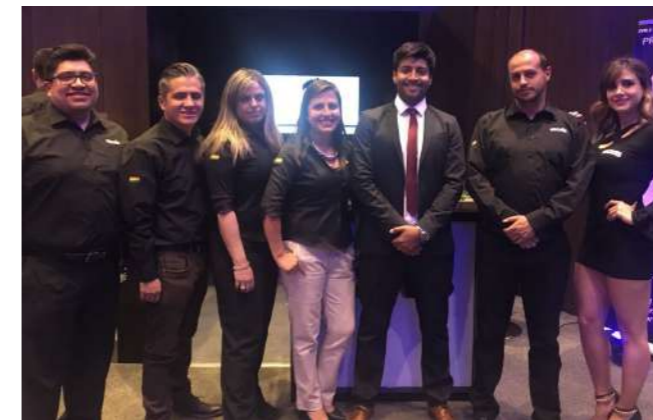
Equipo de Exxis Bolivia en La Paz

Una de las claves del éxito y factor de diferenciación de Exxis consiste en contar con soluciones complementarias para