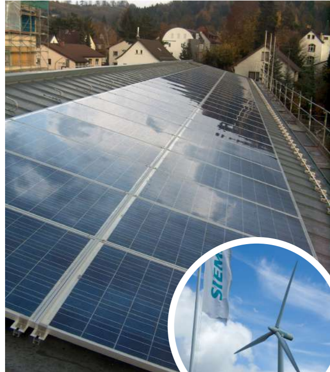
Foto: Paneles solares en Hesse, Alemania